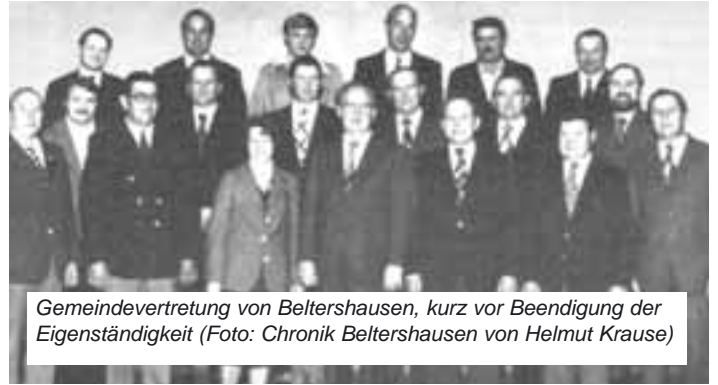
Gemeindevertretung von Beltershausen, kurz vor Beendigung der Eigenständigkeit

nun Mittelpunkt zahlreicher Veranstaltungen der Vereine und politischen Parteien, der Familien- und Dorffeste.“ Wie bereits im Teil über die Schulen beschrieben, hatten die eigenständigen Dörfer einen großen Einfluss auf die Schulentwicklung. Mit der dort einsetzenden Schwerpunktsetzung durch Mittelpunktschulen, wurde auch die Idee der Zusammenlegung von Dörfern zu einer übergeordneten Gemeinde zunehmend diskutiert. Durchaus sehr kontrovers. Denn diese Idee zu Zusammenlegungen, aus der schließlich die hessische Gebietsreform wurde, kam häufig „von oben“ - so jedenfalls die Wahrnehmung und stieß in vielen Dörfern auf Ablehnung. Man fürchtete zu viel der Eigenständigkeit und somit auch der Identität abgeben zu müssen. Doch es gab gute Gründe für eine effektivere Verwaltung und so schlossen sich einige Dörfer freiwillig zu einer „Großgemeinde“ zusammen, noch bevor dann in den 70er Jahren die vom Land Hessen verordnete Gebietsreform in die Tat umgesetzt wurde und die heutigen Kommunalstrukturen entstanden.