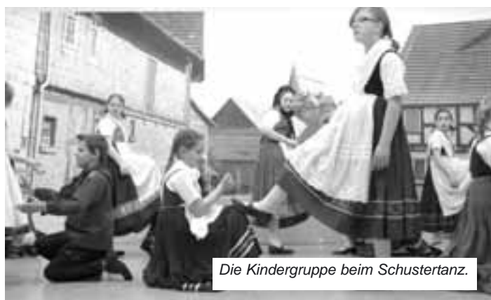
Die Kindergruppe beim Schustertanz.